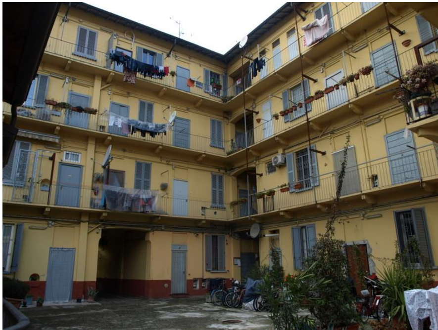
CORTILE INTERNO E SCALA