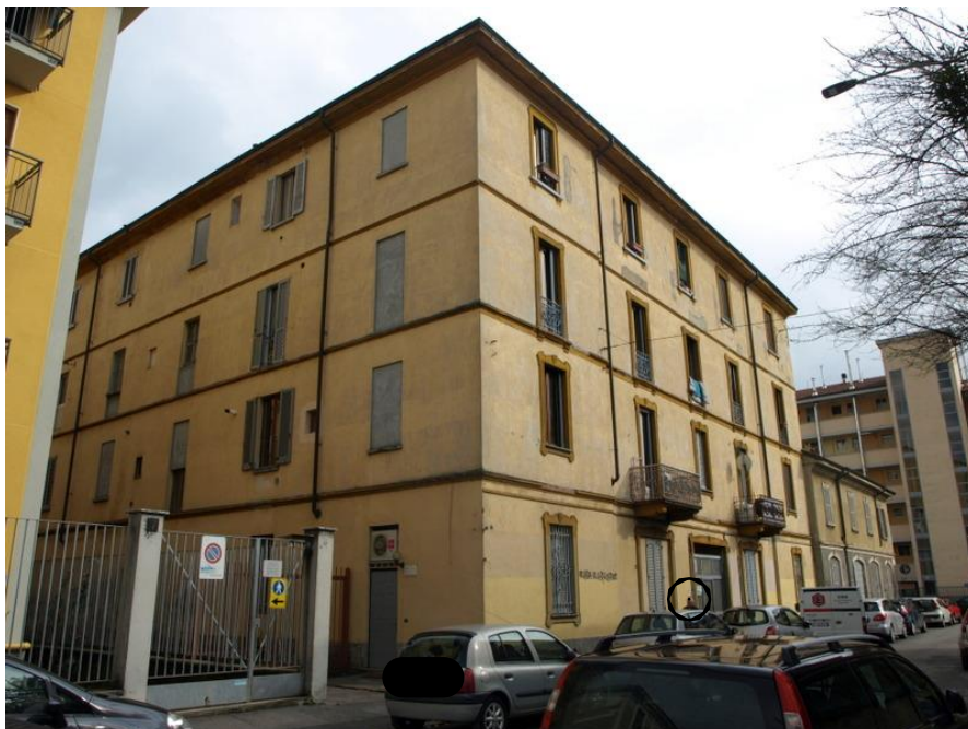
VIA MAZZUCHELLI n°11